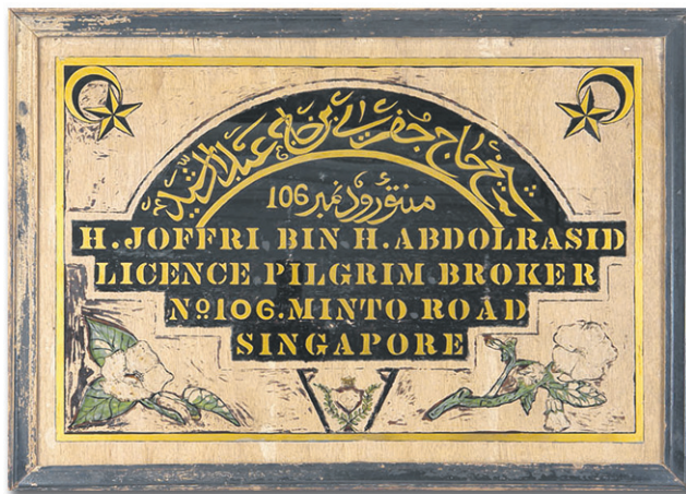
Sebuah papan tanda yang tergantung di kedai seorang sheikh haji di Minto Road Jalan Sultan (Abad ke-20 Koleksi Yayasan Warisan Melayu) – Imej ihsan, Taman Warisan Melayu, Lembaga Warisan Negara

Dari akhir tahun 1800-an hingga pertengahan tahun 1900-an, Singapura merupakan salah sebuah pelabuhan utama buat keberangkatan haji bagi para jemaah dari British Malaya serta Hindia Timur Belanda. Khususnya, Kampong Gelam berperanan sebagai pusat persinggahan yang penting di mana para jemaah haji akan mencari penginapan sementara serta membuat persiapan untuk tahap yang berikut bagi perjalanan mereka ke Makkah. Sheikh-sheikh haji membantu para jemaah haji untuk mengatur perjalanan dan memastikan mereka mempunyai persediaan agama, sementara perniagaan-perniagaan lain juga ditubuh untuk melayani keperluan perjalanan para jemaah haji.