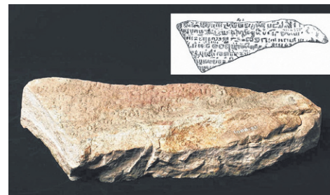
Batu pasir berukir yang dikenali sebagai 'Batu Singapura' (ditemui di muara Sungai Singapura, berhampiran dengan Hotel Fullerton masa kini)

Ini merupakan serpihan daripada monolit berukir yang dikenali sebagai 'Batu Singapura'. Ia merupakan tulisan paling awal yang ditemui di Singapura dan dijumpai di muara Sungai Singapura, berhampiran dengan Hotel Fullerton masa kini. Batu pasir ini berukuran setinggi 3m dan selebar 3m, dan mengandungi 50 baris ukiran di dalam bingkai timbul pada kawasan berukuran setinggi 1.5m dan selebar 2.1m. Pada tahun 1843, ia telah diletupkan semasa kerja raya. Para cendekiawan mempunyai pendapat yang berbeza tentang tarikh dan bahasa tulisan ini. Ia dianggarkan bertarikh dari kurun ke-10 hingga kurun ke-13 dan mungkin berasal dari Sumatra atau Jawa purba.