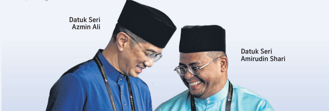
Datuk Seri Azmin Ali