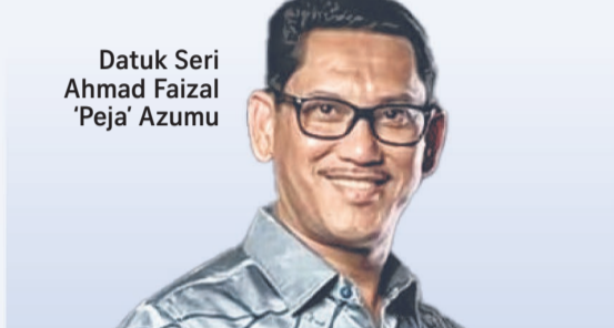
Datuk Seri Ahmad Faizal 'Peja' Azumu

Datuk Seri Anwar Ibrahim, yang juga pengerusi Pakatan Harapan, berkata beliau bertanding di Tambun, Perak, kerana dua sebab utama - untuk merampas kerusi parlimen yang dicuri pengkhianat dan menjadikan Perak garisan depan bagi perjuangan membersihkan kerajaan Malaysia. Bercakap kepada Berita Harian (BH) Datuk Anwar, yang juga calon Perdana Menteri PH, berkata beliau yakin disambut baik oleh penduduk Perak.