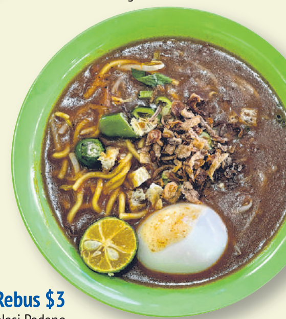
Mi Rebus $3

Oishii Corner Pusat Makanan Kim Keat Palm 22 Lor 7 Toa Payoh