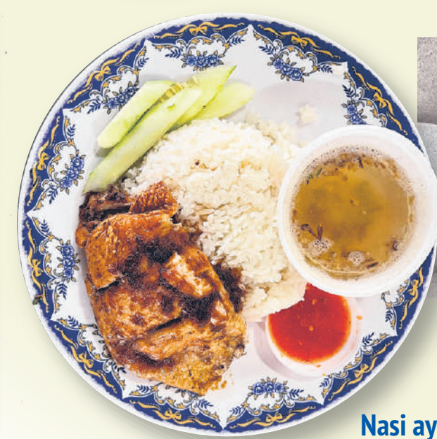
Nasi ayam $4.50

Liza Nasi Padang Pusat Makanan Kim Keat Palm 22 Lor 7 Toa Payoh