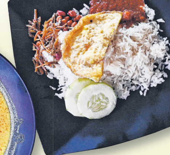
Nasi Lemak $2