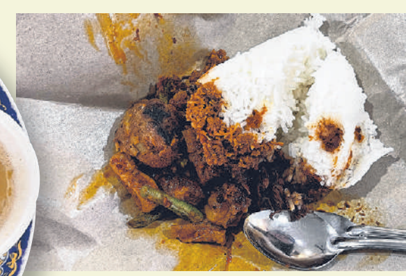
Nasi sambal goreng $3.50

Afghanistan Family Restaurant 201E Tampines Street 23