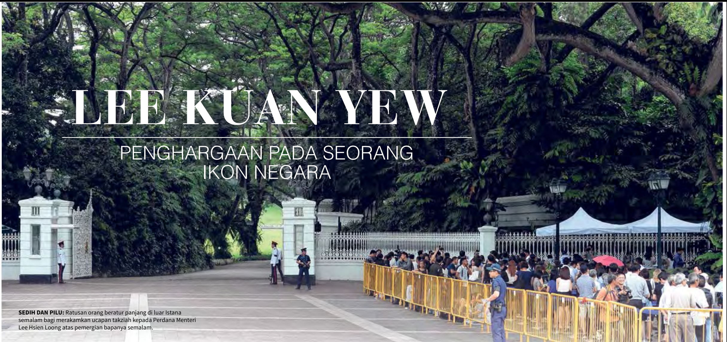
SEDIH DAN PILU: Ratusan orang beratur panjang di luar Istana semalam bagi merakamkan ucapan takziah kepada Perdana Menteri Lee Hsien Loong atas pemergian bapanya semalam.