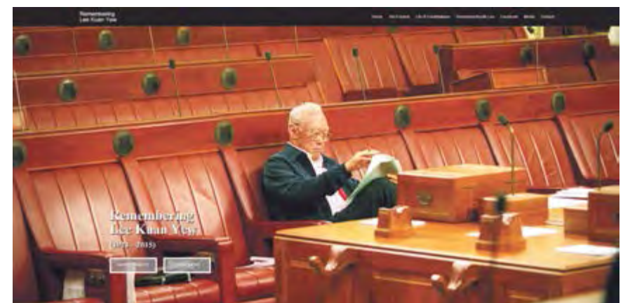
MENINGATI LEE KUAN YEW: Laman Facebook 'Remembering Lee Kuan Yew' ini menerima lebih 131,000 'likes' sekitar 7.30 malam, di mana orang ramai meninggalkan ucapan dan salam takziah.