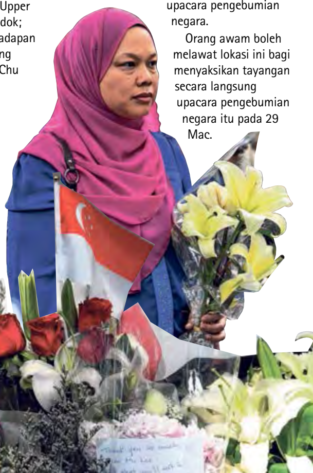
UCAPAN TAKZIAH: Orang ramai meninggalkan ucapan dan bunga di luar Istana semalam sebagai penghormatan kepada mendiang Encik Lee Kuan Yew.

Lokasi masyarakat ini akan beroperasi setiap hari dari 10 pagi hingga 8 malam sehingga 29 Mac iaitu hari upacara pengebumian negara. Orang awam boleh melawat lokasi ini bagi menyaksikan tayangan secara langsung upacara pengebumian negara itu pada 29 Mac.